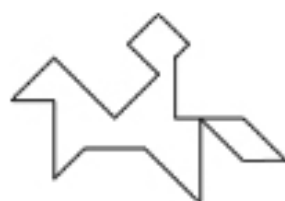
cavalier au pas*