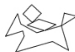
cavalier au galop*