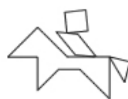
cavalier au trot*